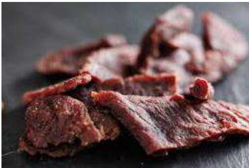
Бизнес-план по производству мясных чипсов 📍 ХМАО