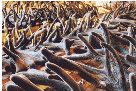
Бизнес-план строительство комплекса по производству БАД из рогов оленя