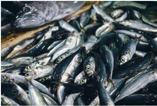
Бизнес-план организация комплекса по рыбодобыче 📍 Байдарацкая губа