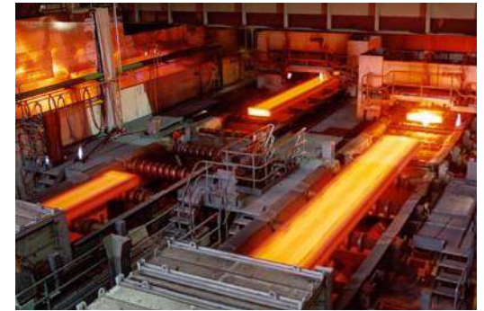
Бизнес-план по производству металлопроката