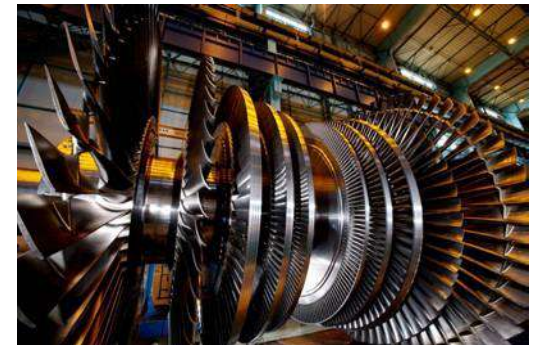
Финансовая модель для получения финансирования у ПАО Газпром под оборудование для ПАО Моторостроителей 📍 г. Тюмень