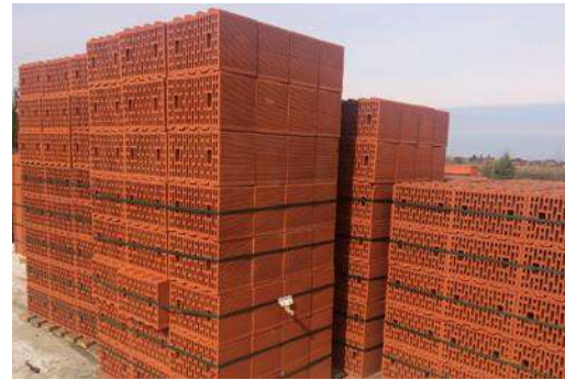
Бизнес-план строительство кирпичного завода