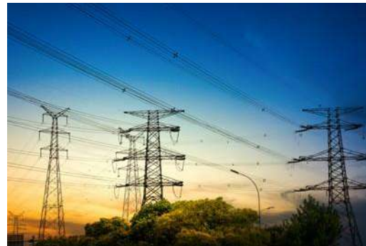
Бизнес-план для приобретения оборудования по строительству ЛЭП