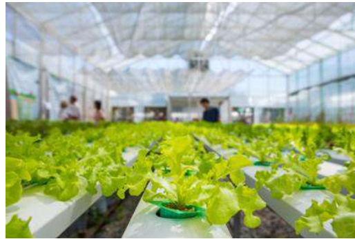
Бизнес-план строительство тепличного комплекса 📍 Тюменская область